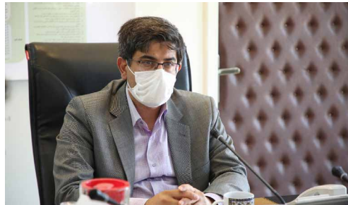
معاون طرح و برنامه وزارت صمت خبر داد:

وی در پایان گفت: مقرر شد لیست مواد خام با همکاری وزارت صنعت، معدن و تجارت و وزارت اقتصاد و اتاق بازرگانی تهیه و برای تصویب نهایی به دولت ارائه شود.