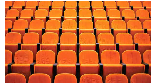
آیا کارآفرینی قابل آموزش در مدارس کسب و کار هست؟