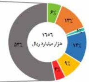
سهم رسته فعالیت‌ها از محصول ناخالص داخلی در فصل بهار سال ۱۳۹۹ (به قیمت ثابت سال ۱۳۹۰)