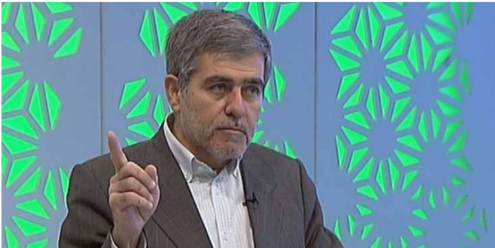
رئیس کمیسیون انرژی مجلس خبر داد: