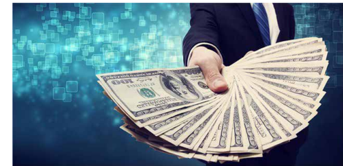
بر اساس مصوبات کمیته اقدام ارزی صورت خواهد گرفت:

گفتنی است، کارگروه پایش رفتار تجاری از نمایندگان وزارت صمت، اتاق بازرگانی، صنایع، معادن و کشاورزی، گمرک ایران و اتاق تعاون ایران تشکیل شده است.