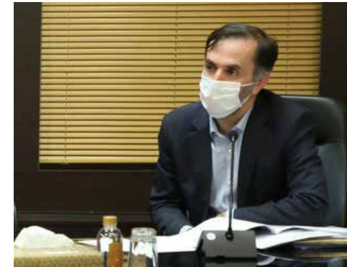
رییس کل سازمان توسعه تجارت ایران در همایش اوراسیامطرح کرد:

سهم ۰.۳ درصدی ایران از تجارت اوراسیا با جهان زادبوم با بیان اینکه آمارهای سال ۲۰۱۸ نشان می‌دهد، سطح تجارت اوراسیا با جهان حدود ۸۶۶ میلیارد دلار است، افزود: بخش مهمی از تجارت روسیه با جهان شامل نفت و گاز است، اما پتانسیل تجارت بالایی با این کشور وجود دارد که سهم تجارت ایران در این میان تنها ۰.۳ درصد است. همچنین سهم اتحادیه اقتصادی اوراسیا از تجارت ایران با جهان نیز حدود ۲ درصد است که نیاز به فعالیت بیشتری در این زمینه وجود دارد.