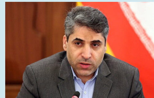
در گفت و گو با ایسنا اعلام شد