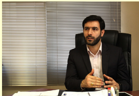
رئیس مرکز توسعه تجارت الکترونیکی وزارت صمت:

وی اضافه کرد: طبق مذاکرات انجام شده با مسئولان گمرک جمهوری اسلامی ایران، در طول دوره اختلال، گمرک جمهوری اسلامی با اختیارات قانونی خود برای ترخیص کالاهای سریع الفساد اقدام نموده و در این خصوص مشکلی وجود نداشته است.