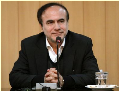
رئیس کل بیمه مرکزی خبر داد