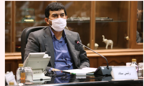
سرپرست وزارت صنعت، معدن و تجارت تاکید کرد: