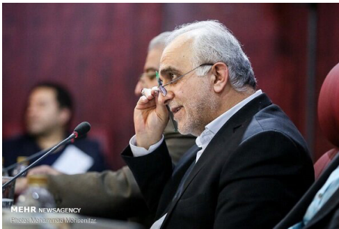
باصدور احکامی از سوی وزیر اقتصاد