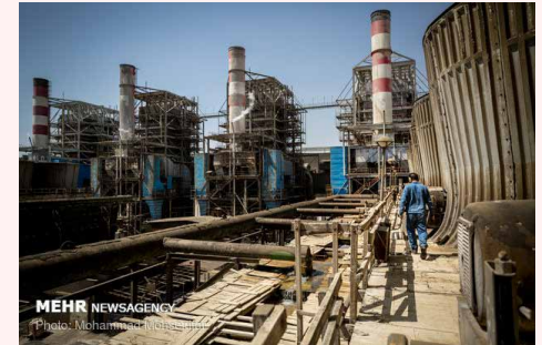
مدیرعامل برق حرارتی:

وی با اشاره به اینکه پاییز امسال عملیات اجرایی ساخت نیروگاه جدید ری آغاز خواهد شد، ادامه داد: بر اساس برنامه‌ریزی صورت گرفته واحد نخست گازی نیروگاه ۲۴ ماه بعد و واحد دوم گازی مجموعه نیز دو ماه پس از افتتاح واحد اول به بهره‌برداری خواهد رسید. همچنین بخش بخار نیروگاه نیز ۱۲ ماه پس از افتتاح اولین واحد مجموعه وارد مدار خواهد شد تا بر این اساس مجموع نیروگاه جدید ری طی ۳۶ ماه به طور کامل به بهره‌برداری برسد.