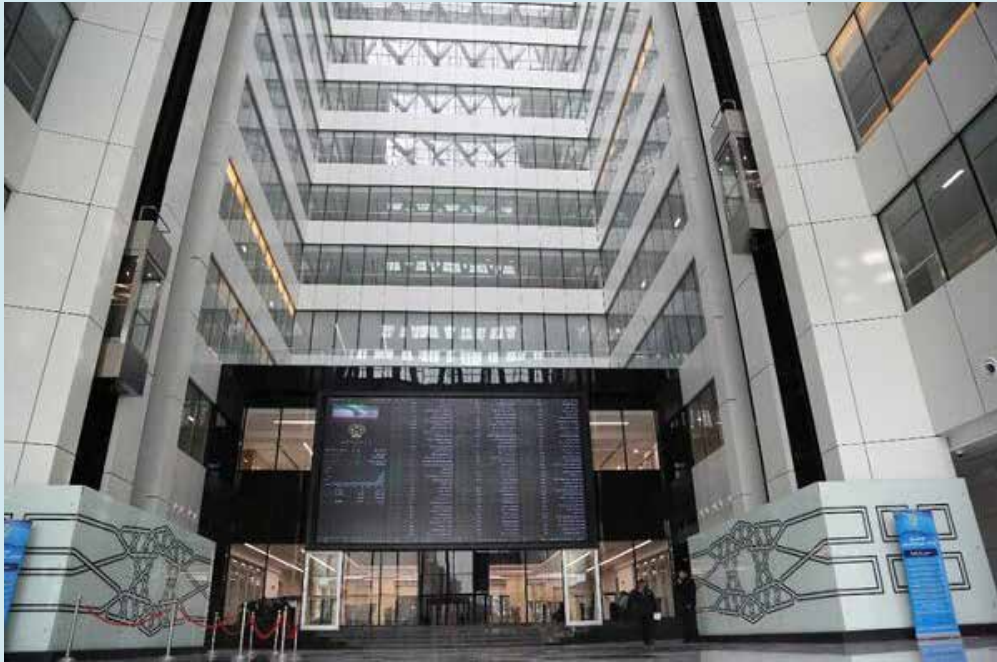
در ساعت اولیه رخ داد