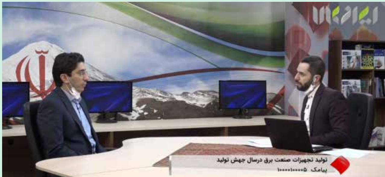
تولید تجهیزات صنعت برق در سال جهش تولید پیامک ۱۰۰۰۰۱۰۰۰۰۵