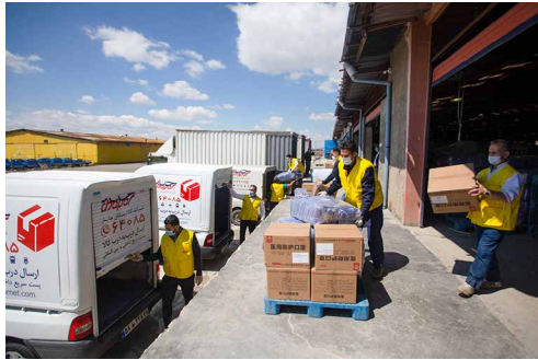
نمایندگان بخش خصوصی از اقدامات نیکوکارانه فعالان اقتصادی می‌گویند

برنامه مرور تجربه کمپین نفس و تلاش اتاق‌های بازرگانی برای کمک به کادر درمان و مقابله با کرونا، روز دوشنبه ۳۰ تیر از ساعت ۱۷ تا ۱۹.۳۰ و بر بستر فضای مجازی برگزار خواهد شد. فعالان اقتصادی، نیکوکاران و خیرین، فعالان حوزه مسوولیت اجتماعی و تمامی علاقمندان برای ثبت‌نام و حضور در این برنامه که به صورت آنلاین برگزار می‌شود می‌توانند به لینک زیر مراجعه کرده و ثبت‌نام کنند.