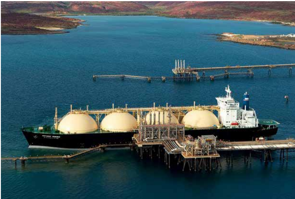
ظرف ۵ سال آینده