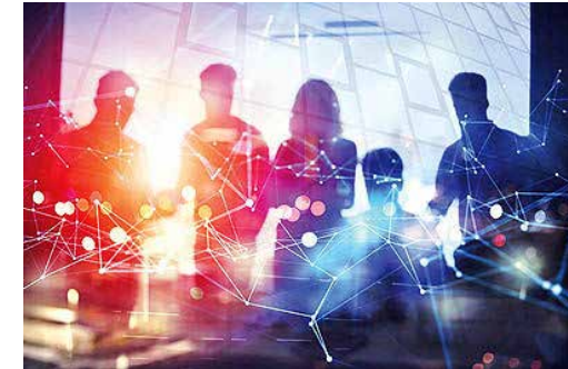
تغییرات اصول مدیریت در عصر ارتباطات