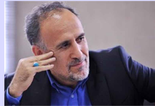
نکاتی در خصوص گواهی سپرده یورویی