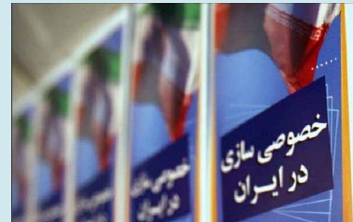
در برنامه تلویزیونی مطرح شد