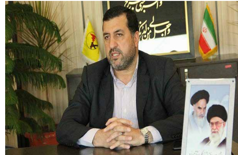
در پاسخ به مهر اعلام شد

رئیس کل بانک مرکزی اعلام کرد: گزارشات خوبی از افزایش قابل توجه صادرات نفت و فرآورده‌های نفتی و صادرات غیرنفتی و خبرهای مثبت از آزاد شدن منابع مسدودی بانک مرکزی دریافت کرده‌ام که روند تأمین ارز را متحول خواهد کرد.