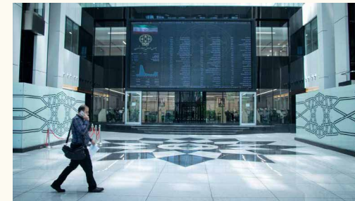
تفاهم‌نامه ایجاد پنجره واحد برای ورود شرکت‌های خصوصی به بورس امضا شد

با وجود امتیازهای ورود هرچه بیشتر بخش خصوصی به بازار سهام اما نقدها و نیازهایی هم در این باره مطرح شده است. از جمله این نقدها طولانی بودن مدت زمان پذیرش بنگاه‌هاست و از جمله نیازهای مبرم شرکت‌ها، برقراری دوره‌های آموزشی برای رسیدن به شناختی واقعی از بورس و ظرفیت‌های آن است.