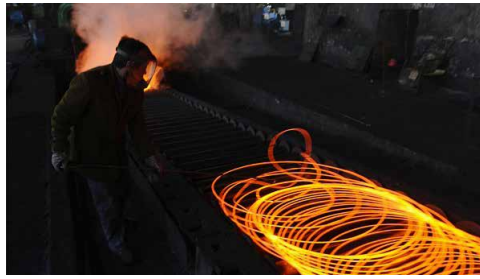
سرمایه در گردش به یکی از چالش‌های اصلی بنگاه‌های اقتصادی بدل شده است

دوم استفاده از تأمین مالی بیرونی است. البته کاهش موجودی مواد اولیه و انبار در بنگاه‌های تولیدی ممکن است این واحدها را از سطح تولید بهینه دور کند و این موضوع خود یک هزینه برای بنگاه تلقی می‌شود، نرخ سود تسهیلات سرمایه در گردش نیز هزینه روش دوم یا تأمین مالی بیرونی است. در ۹ ماهه سال ۱۳۹۸ و قبل از وقوع شیوع ویروس کرونا نرخ رشد اقتصادی بدون نفت منفی بوده و بخش ساختمان با نرخ رشد ۹/۶ درصدی نیز نتوانسته از نرخ رشد منفی اقتصاد بدون نفت جلوگیری کند. با در نظر گرفتن این شوک روی عرضه طبعاً تقاضای کل اقتصاد نیز دچار کاهش شده است که شواهد آن را در کاهش مصرف خصوصی و سرمایه‌گذاری می‌توان مشاهده کرد. نرخ رشد تشکیل سرمایه ثابت ناخالص در ۹ ماهه سال ۱۳۹۸ به ۲/۶ - درصد رسیده و نرخ رشد مصرف خصوصی ۶ - درصد بوده است. کاهش سرمایه‌گذاری و همچنین کاهش مصرف خصوصی حاکی از گرفتار شدن اقتصاد به یک رکود اقتصادی در کنار تورم بوده و سیاست‌گذاری برای حداقل کردن همزمان نوسانات اسمی و حقیقی اقتصاد را به اولویت اول سیاست‌گذاری اقتصادی تبدیل ساخته است. اما با رکود تورمی، تمایل بانک‌ها به پرداخت تسهیلات سرمایه در گردش هم کاهش خواهد یافت. در این بین افزایش قیمت مواد اولیه، دستمزد و نرخ ارز هم موجب افزایش هزینه‌های جاری بنگاه شده و تقاضای تسهیلات سرمایه در گردش بنگاه‌ها به ازای هر واحد تولید را افزایش داده است. از آنجایی که تورم تولیدکننده و مصرف‌کننده برابر نیست با فشار هزینه‌های تولید، بخشی از بنگاه‌ها، به نقطه توقف رسیده و مابقی برای حفظ خط تولید، نیازمند سرمایه در گردش بیشتری هستند.