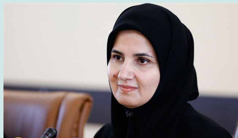
معاون حقوقی رئیس‌جمهوری در گفت‌وگو با پایگاه خبری اتاق ایران

معاون حقوقی رئیس‌جمهوری همچنین از انجام برخی اقدامات برای موثر کردن قوانین و مقررات برای بنگاه‌های کوچک و متوسط خبر داد.