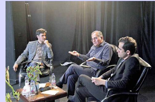
در یک نشست با حضور کارشناسان و اقتصاددانان مطرح شد