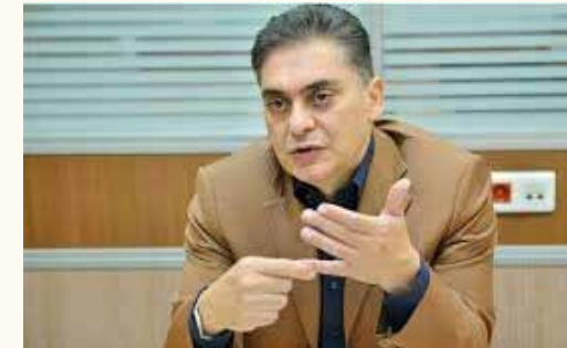
رئیس کنفدراسیون صادرات ایران مطرح کرد