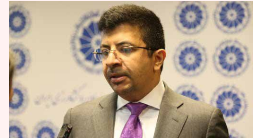
«کوایران» آسیب‌شناسی کرد

کلاهی بر این باور است در صنعتی که یک نوع مونوپولی طبیعی روی آن حاکم است، رگولاتوری قوی باید وجود داشته باشد تا قیمت عادلانه را تعیین کند. او معتقد است حتی در آزادترین اقتصادهای دنیا که دولت در قیمت‌گذاری‌ها کمترین نقش را دارد این مکانیزم وجود دارد. نایب‌رئیس کمیسیون صنعت و معدن اتاق تهران در ادامه اظهار کرد: موضوع بعدی این است که در هیچ‌جای دنیا این‌قدر تعرفه‌های مختلف وجود ندارد. به‌طور مثال تعرفه مجانی برای اماکن مذهبی و آموزشی و تعرفه کشاورزی که عملاً یک تیر به خودی بوده تعدادی از این تعرفه‌ها به‌شمار می‌روند.