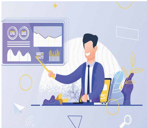
شرکت‌های سودمحور در جذب نقدینگی پیشی گرفتند