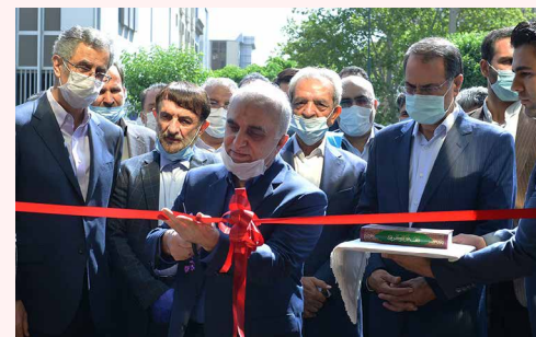
با حضور نمایندگان دولت و بخش خصوصی در اتاق تهران افتتاح شد: