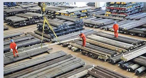
نرخ گذاری دستوری کنار گذاشته شد؛ قیمت هادر بازار کاهش یافت