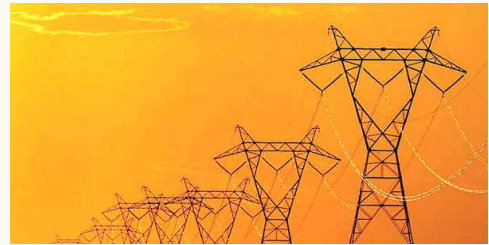
مصرف برق قبل از تابستان به رقم بی سابقه ۵۳ هزار و ۵۰۲ مگاوات رسید

شوگ قرنطینه به مصرف برق دنیای اقتصاد: شوگ خانه‌نشینی شیوع کرونا و دورکاری به مصرف برق رسید. پیک مصرف تاکنون ۱۲/۸ درصد نسبت به مدت مشابه سال گذشته افزایش یافته و از ابتدای سال تاکنون رشد ۴/۲ درصدی مصرف انرژی ثبت شده است. تحلیلگران صنعت برق معتقدند پارامترهای «افزایش مصرف خانگی به دلیل خانه‌نشینی و قرنطینه» و «پلت‌فرم‌های دورکاری» باعث مصرف موازی برق در «خانه» و «محل کار» شده و رکوردزنی مصرف برق را به همراه داشته است. میزان مصرف برق کشور به رقم ۵۳ هزار و ۵۰۲ مگاوات رسیده است.