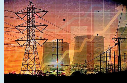
در گفت‌وگوی فعالان بخش خصوصی با «دنیای اقتصاد» بررسی شد