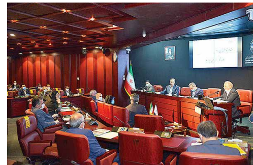
نظرسنجی از حدود ۱۰۰۰ فعال اقتصادی؛ کووید-۱۹ با تولید چه خواهد کرد؟