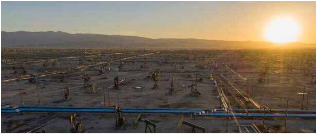
آژانس بین‌المللی انرژی هشدار داد: