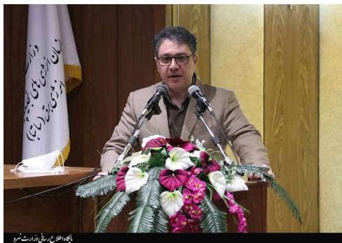
رئیس جدید ساتبا:

وی توجه ویژه به پویش #هرهفته_الف_ایران را از دیگر اولیتهای خود برشمرد و افزود: جمعی از تیم فنی سازمان درگیر رصد مشکلات بخش‌های خصوصی هستند تا پروژه‌ها به موقع به شبکه برق متصل شوند.