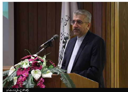
وزیر نیرو در آیین تودیع و معارفه رئیس ساتبا:

تامین صنعت برق به دلیل تعطیلی کارخانجات و کمبود مواد اولیه در سطح داخل و خارج کشور، اختلال در خدمات گمرکی، اختلال در انجام حواله‌های ارزی، اختلال در خدمات بانکی و فشار بانک‌ها برای مطالبه، بازپرداخت اقساط تسهیلات، عدم پایبندی بانک‌ها به بخشنامه‌های صادره در این خصوص، فقدان شدید نقدینگی به دلیل عدم انجام تعهدات مالی از سوی کارفرمایان دولتی و خصوصی، عدم حضور موثر کارفرمایان دولتی در نهادهای مربوطه، محدودیت‌های نیروی انسانی، اختلال در روند صادرات تجهیزات و خدمات فنی و مهندسی، تحمیل هزینه‌های رعایت پروتکل‌های بهداشتی و همچنین فقدان پوشش بیمه‌های بازرگانی به عنوان اهم مصادیق اثرات اقتصادی ویروس کرونا بر بنگاه‌های صنعت برق یاد شده است. در ادامه با اشاره به اینکه موضوع بررسی مشاغل آسیب‌دیده از کرونا در کارگروه مقابله با پیامدهای اقتصادی ناشی از شیوع کرونا در نهاد ریاست جمهوری در حال بررسی است، از ایشان درخواست شده است سازندگان، پیمانکاران، مشاوران صنعت برق و به نوعی صنعت احداث و خدمات فنی و مهندسی در فهرست مشاغل آسیب‌دیده ناشی از شیوع کرونا قرار گرفته و از تسهیلات مرتبط دولت برخوردار شوند. در پایان نامه تاکید شده است در صورت عدم تامین نقدینگی برای تأمین‌کنندگان کالا و خدمات صنعت برق به‌منظور گذر از این مرحله بحرانی کشور، بنگاه‌های فعال در این صنعت با خطر ورشکستگی و تعطیلی مواجه شده و زنجیره تأمین صنعت برق مختل خواهد شد. شایان ذکر است شرح اثر هر یک از مصادیق آسیب‌پذیری صنعت برق از اثرات اقتصادی شیوع ویروس کرونا در این نامه پیوست شده و مصادیق تکمیلی در گزارش آتی سندیکا ارائه خواهد شد.