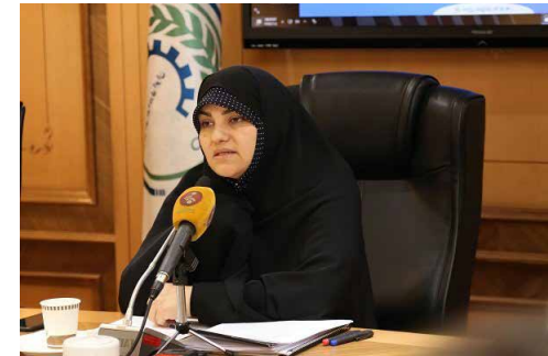
رئیس سازمان ملی بهره‌وری: