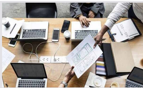
مهر خبر می‌دهد