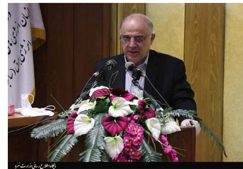
معاون برق و انرژی وزیر نیرو عنوان کرد:

وی گفت: امید است در شرایط جدید و در فضای نو در سال‌های آینده هم بتوان قدم‌های بسیار بزرگی را در این دو مقوله داشته باشیم.