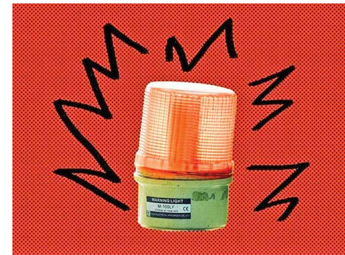
سازمان‌ها باید بین بحران و فاجعه تمایز قائل شوند