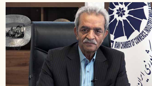
طبق پیش‌بینی موسسه فیچ سلوشنز