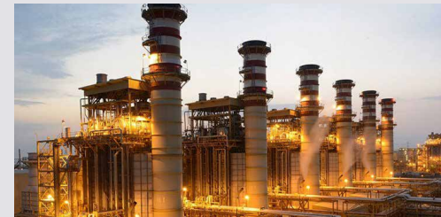
رئیس هیات مدیره سندیکای صنعت برق در گفت‌وگو با بورس نیوز تاکید کرد:

بورس نیوز متذکر می‌شود نرخ خرید برق از نیروگاه‌ها، با تعرفه برق مشترکین خانگی متفاوت بوده و افزایش نرخ برق نیروگاه‌ها، به معنای افزایش تعرفه برق مشترکین نیست. در این خصوص اینجا بیشتر بخوانید.