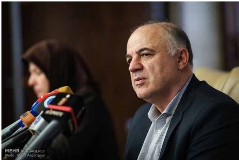
معاون وزیر نیرو: