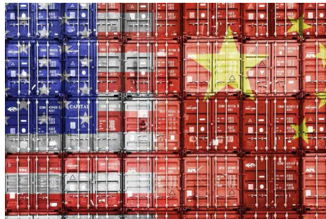
یک اتاق فکر هشدار داد:

وی گفت: سطح هدف تعیین شده در این توافق هرگز واقع‌گرایانه نبوده و این‌ها تنها اعدادی هستند که برای جلب توجه افکار عمومی و برانگیختن تحسین آنها اعلام شده بودند. حالا پاندمی کرونا این ارقام غیر واقع‌گرایانه را غیرممکن ساخته است. تحت تأثیر ویروس کرونا در ۳ ماهه اول امسال صادرات آمریکا به چین ۱۰ درصد افت کرد. بدتر از همه صادرات انرژی بودند که ۳۳ درصد سقوط داشتند. صادرات هواپیمای مسافربری عملاً به صفر رسید و فروش خودرو ۴۶.۹ درصد سقوط کرد و صادرات دانه سویا هم ۳۹.۴ درصد پایین آمد.