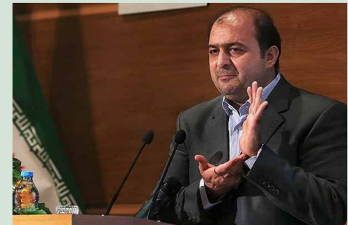
معاون وزیر اقتصاد خبر داد

به گفته معاون وزیر اقتصاد، قیمت هر یونیت سرمایه‌گذاری این صندوق ۱۰ هزار تومان است که در آن نسبتی از سهام بانک‌های ملت، صادرات و تجارت و بیمه‌های البرز و اتکایی امین لحاظ شده است ضمن اینکه دارندگان کد بورسی می‌توانند با نماد «دارا یکم» این سهام را بخرند ولی در حال حاضر نیازی به داشتن کد بورسی برای خرید این سهام نیست.