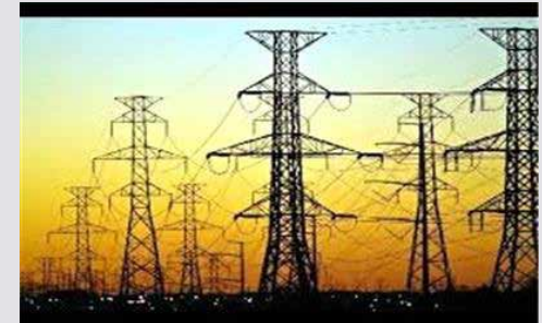
هدر رفت روزانه ۶۰۰ میلیون تومان در صنعت برق فشار مضاعف کرونا به صنعت آب و برق

این کارشناس حوزه انرژی با اشاره به افزایش یالانه ۷ درصدی قیمت آب و برق ابراز کرد: وزارت نیرو به دلیل نحوه قیمت گذاری غیر واقعی با بدهی انباشت شده فراوانی مواجه است و افزایش ۷ درصدی تعرفه