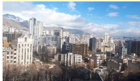
با مصوبه ستاد مقابله با کرونا

ضوابط اجرایی این تبصره توسط سازمان امور مالیاتی کشور و بانک مرکزی جمهوری اسلامی ایران تعیین و ابلاغ خواهد شد.