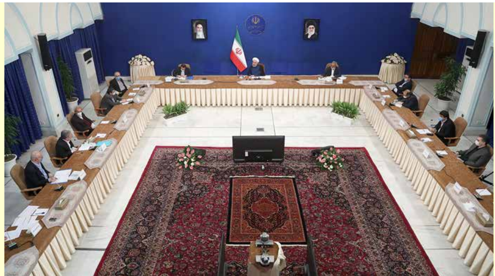
رئیس کمیسیون تسهیل تجارت و توسعه صادرات اتاق بازرگانی تهران مطرح کرد