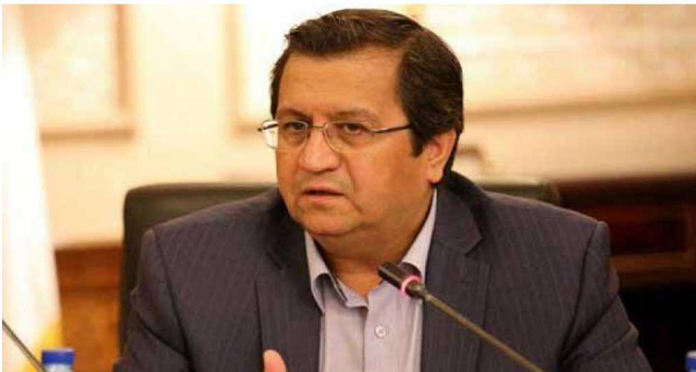
رئیس کل بانک مرکزی: