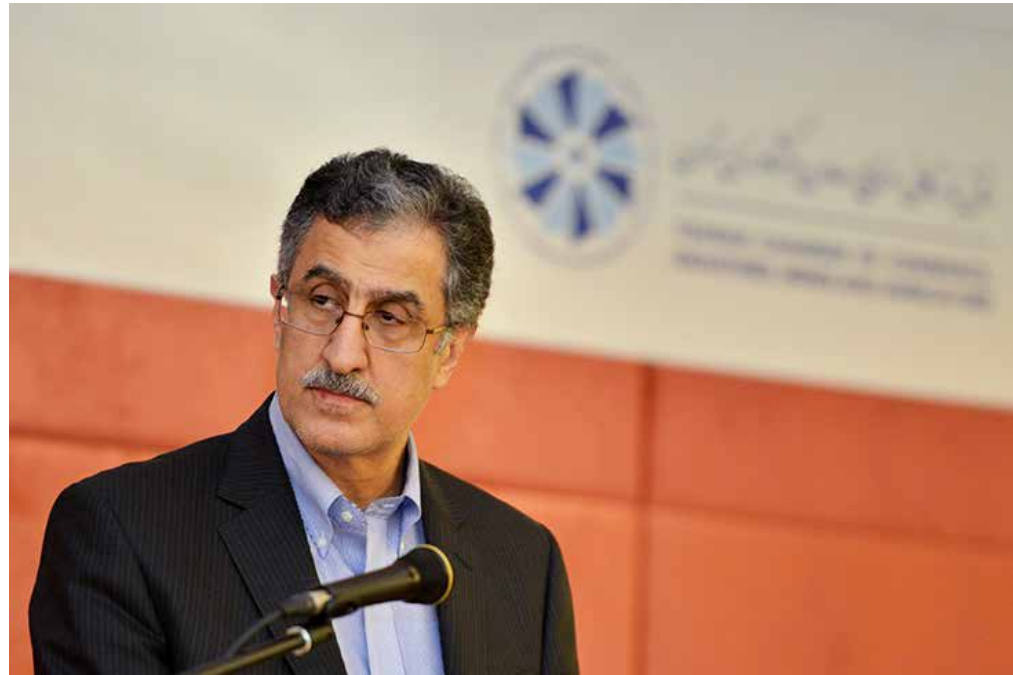
رئیس اتاق بازرگانی، صنایع، معادن و کشاورزی تهران مطرح کرد