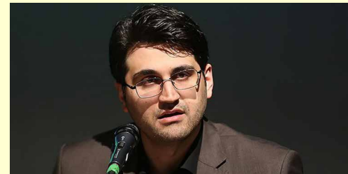
شرایط سخت مالی دولت و حیرانی انتخاب بین دوگانه سلامت و اقتصاد