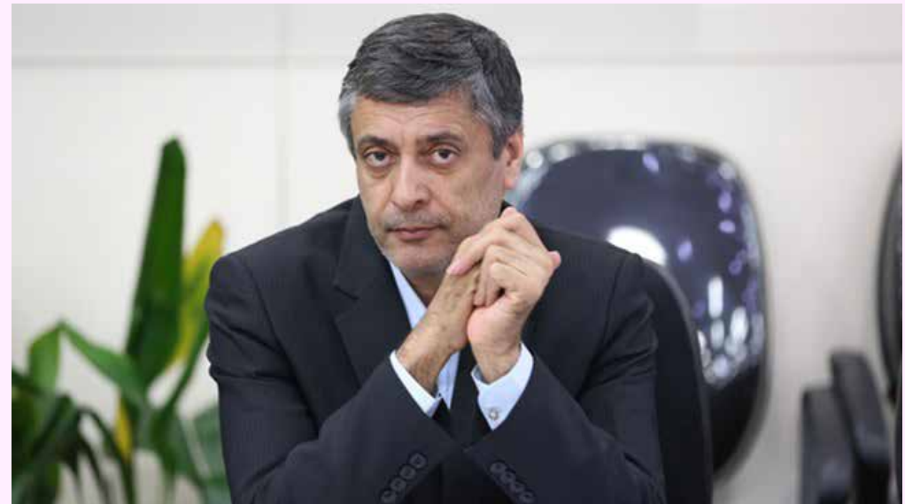
یادداشت مهدی طبیب‌زاده برای پایگاه خبری اتاق ایران