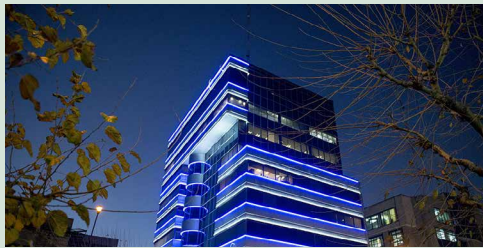
پیشنهادات فوری و کوتاه‌مدت اتاق بازرگانی تهران به دولت برای کاهش اثرات منفی اقتصادی کرونا

متن این بسته سیاستی پیشنهادی را اینجا دریافت و مطالعه کنید.