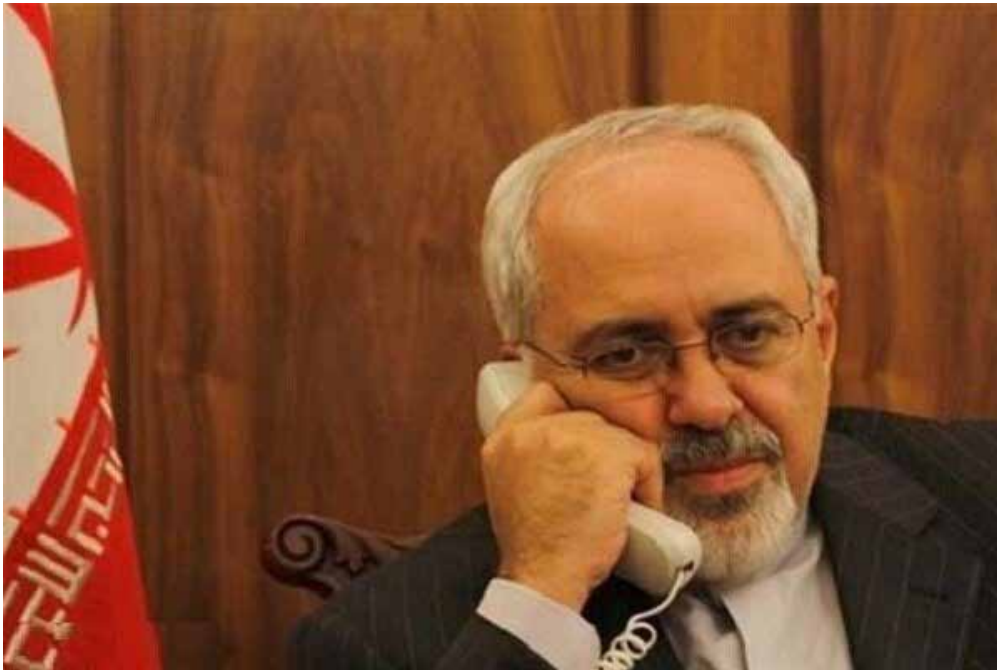
وزیر خارجه کویت در تماس با ظریف: