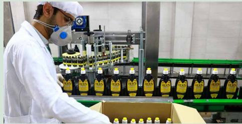
تدوین بسته حمایت از صنایع کرونازده