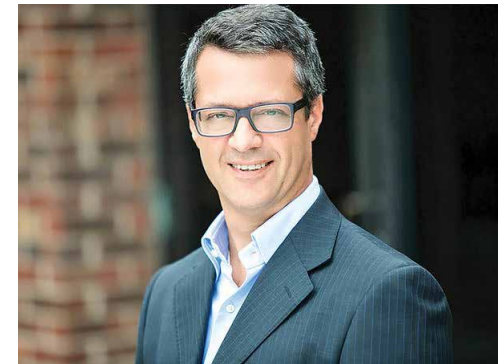
گفت‌وگو با مدیر منابع انسانی بانک سانتاندر: