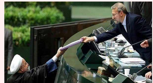
مهر گزارش می‌دهد؛

عضو کمیسیون برنامه و بودجه مجلس شورای اسلامی بیان کرد: ضعف نمایندگان مجلس باعث شد که امسال هم مثل سال‌های گذشته بودجه شرکت‌های دولتی مورد بررسی قرار