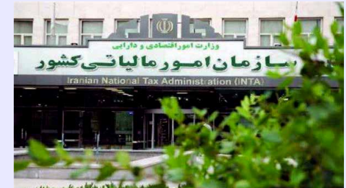
معاونت درآمدهای مالیاتی سازمان امور مالیاتی کشور ابلاغ کرد:

۳- اولویت‌بندی امور مبتنی بر اصل اهمیت باشد به‌گونه‌ای که تمرکز برای وصول درآمدهای مالیاتی در مدت باقیمانده بر پرونده‌های بزرگ باشد و از پیگیری برای وصول از پرونده‌های مالیاتی کم‌اهمیت اجتناب گردد.