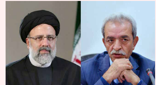
پیشنهاد رئیس اتاق ایران به رئیس ۸ قوه قضائیه؛

رئیس اتاق ایران در پایان این نامه ابراز امیدواری کرد با یک عزم ملی و همکاری نزدیک بتوانیم اقتصاد ایران و معیشت جامعه را از گردنه دشوار بحران کرونا و اثرات آنی بر فضای کسب‌وکار و ساختار اقتصادی کلان کشور عبور دهیم.