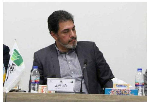
در گفتگو با نایب رئیس هیئت مدیره سندیکای صنعت برق بررسی شد:

وی افزود: چنانچه مشاهده می‌کنیم نه تنها نوسانات قیمت جهانی بر نفت اثرگذار است بلکه از ناحیه تحریم نیز آسیب‌پذیر است. به طور کلی نفت و گاز در مقایسه با برق آسیب‌پذیرتر هستند. از یک طرف به دلیل ماهیت انتقال و عرضه آن‌ها و از سوی دیگر به دلیل رقیبان بین‌المللی که وجود دارند. اما برق یک منطقه مشخصی را پوشش می‌دهد. برق را باید در لحظه تولید و مصرف کرد و نمی‌توان آن را