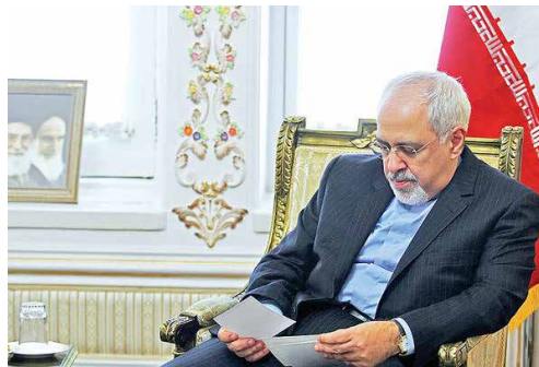
وزیر خارجه به دبیرکل سازمان ملل نامه نوشت

همواره با تدبیر از سخت‌ترین بزنگاه‌ها به سلامت و موفقیت عبور کرده است. در تجربه کشورها شامل ایتالیا، آمریکا، ژاپن و کره جنوبی می‌توان دید که شرط موفقیت اقدامات بهداشتی، شامل قرنطینه و منع مسافرت و تعطیلی فعالیت‌های اقتصادی باید همراه با یک بسته پر قدرت مالی و حمایتی اقتصادی باشد؛ اقدامات نباید قطره‌ای باشد، بلکه باید همه‌جانبه و به‌صورت فوری و منسجم انجام بگیرد. تجربه این مدت در دنیا نشان می‌دهد بدون این بسته حمایتی اقتصادی نمی‌توان و نباید از مردم خواست یا آنها را مجبور به قرنطینه یا سایر اقدامات کرد. این اقدامات حمایتی باید در قالب کمک‌های سریع نقدی به همه خانواده‌هایی که منبع درآمد خود را در شرایط قرنطینه از دست می‌دهند، باشد. این خانواده‌ها آنهایی هستند که سرپرست خانواده، درآمد ثابتی از دولت یا شرکت‌های وابسته ندارد. این افراد به راحتی در سامانه یارانه‌های کشور قابل شناسایی هستند. تمام خانواده‌ها باید به میزان حداقل حقوق یک ماه یک خانواده کارگری یا کارمندی، مبالغی را در حساب خودشان دریافت کنند. در کنار این اقدام، باید بسته حمایت از صنایع کوچک و صاحبان مشاغل آزاد به صورت تخفیف مالیاتی، معافیت سودهای بانکی و نیز اعطای وام‌های سرمایه در گردش اقدام کرد. همه این اقدامات باید به صورت یک بسته اجرا شود تا موفقیت آن تضمین شود. فرصت تعطیلات عید بهترین فرصت برای اجرای این طرح و قرنطینه است تا کمترین آسیب به شرکت‌ها و مردم وارد شود. امید اینکه سیاست‌گذاران، این بار اشتباهات قبلی را تکرار نکنند و به سرعت و طی دو هفته آینده رشد این بیماری در کشور متوقف شود و مردم به زندگی طبیعی خود بازگردند.