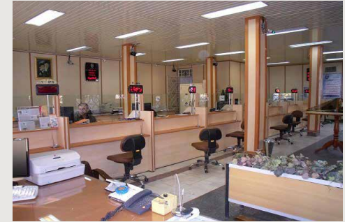
شورای هماهنگی بانک‌ها اعلام کرد: