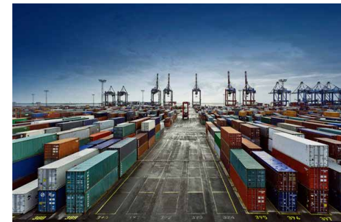
مهر خبر می‌دهد:

۱. پس از اعلام سازمان‌های متولی صدور مجوزهای قانونی (بهداشت، درمان و آموزش پزشکی، دامپزشکی، حفظ نباتات، استاندارد و نظایر آنها) مبنی بر عدم انطباق یا مردودی