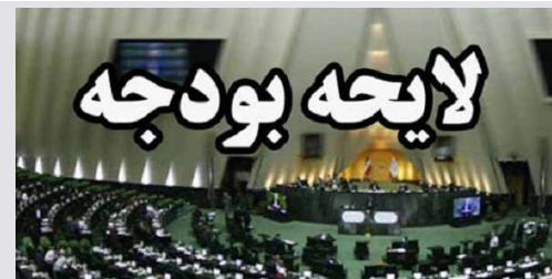
مرکز پژوهش‌های مجلس مطرح کرد