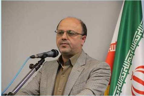
معاون وزیر نیرو خبر داد: