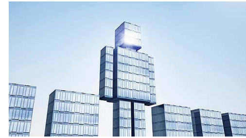
ویژگی رهبران سازمانی قرن ۲۱ از نظر مدیر فوجیتسو