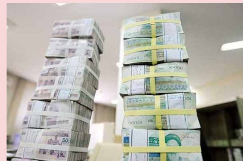
موافقت فقهای شورای نگهبان

یادآور می‌شود، بانک مرکزی اولویت بخشش سود تسهیلات ناشی از اجرای تبصره ۳۵ قانون اصلاح قانون بودجه سال ۱۳۹۵ و تنفیذ آن طی