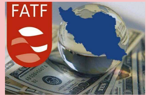
مهر گزارش می‌دهد