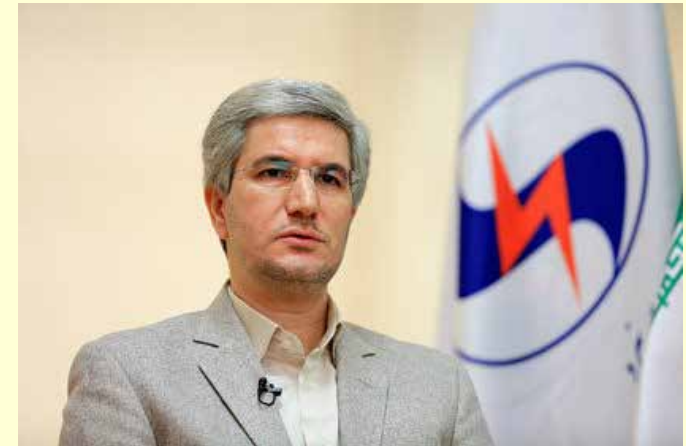
مدیرکل دفتر حمایت از ساخت داخل ساتکاب اعلام کرد:

مدیرکل دفتر حمایت از ساخت داخل و توسعه صادرات ساتکاب در پایان افزود: این اکوسیستم از سوی ساتکاب به منظور تامین کالای آب و برق با رویکرد ساخت داخل در حال توسعه و رشد می‌باشد و یک اکوسیستم زنده و پویا است.