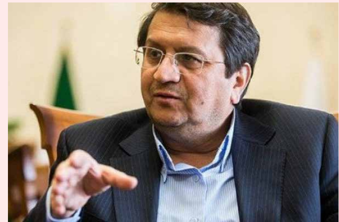
همتی در پاسخ به مهر مطرح کرد

رئیس کل بانک مرکزی افزود: حتی با گذشت یک ماه نیز دریافت کننده گواهی می‌تواند آن را در بازار سرمایه به فروش برساند.