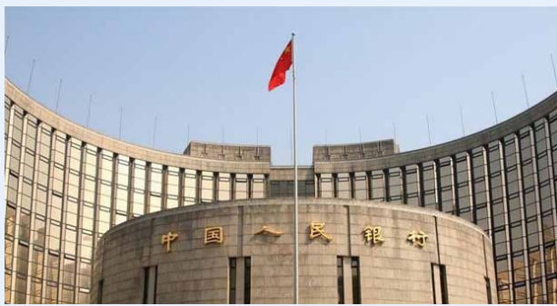
با تزریق ۱.۲ تریلیون یوان