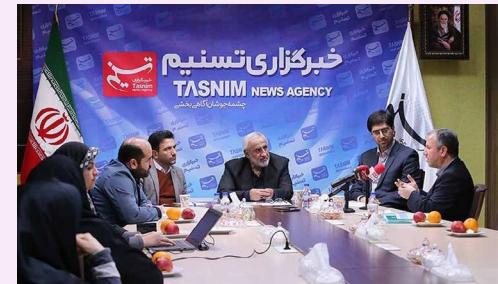
بزرگترین بدهکاران بانکی، مدیران عامل بانک ها را انتخاب می کنند