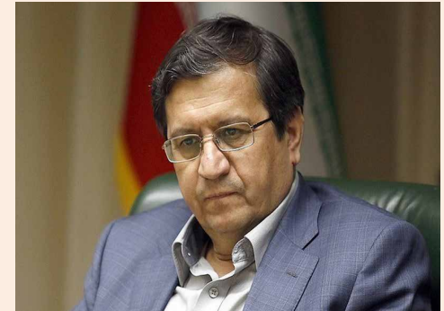
فعالاً تمرکزمان برای تغییر نرخ سود بانکی نیست