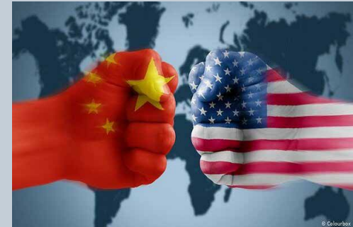
مهر گزارش می دهد