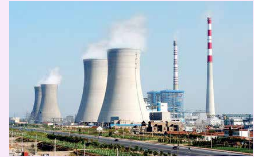
سندیکای صنعت برق مخالف تهاثر بدهی نیروگاه‌داران و وزارت نیرو از محل منابع صادراتی برق است