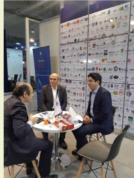
با حضور ۱۴۰ شرکت داخلی و خارجی

علاوه بر این، همزمان با برنامه‌های وزارت نفت به منظور بومی سازی ۱۰ قلم کالای پرمصرف صنعت نفت کشور شامل تجهیزات سرچاهی و رشته تکمیلی درون‌چاهی، پمپ‌های درون‌چاهی، انواع مته‌های حفاری، انواع شیرهای کنترلی، ایمنی و تجهیزات جانبی، انواع لوله‌ها، الکتروموتورهای ضد انفجار و دور متغیر، ماشین‌های دوار، فولادهای آلیاژی CRYOGENICS، ابزارهای اندازه‌گیری حفاری و ساخت پیگ‌های هوشمند، برنامه‌ریزی شده که در شانزدهمین نمایشگاه انرژی کیش، با حضور مسئولان شرکت ملی نفت، فرصت مشارکت بیشتر سازندگان ایرانی در این پروژه‌ها فراهم شود.