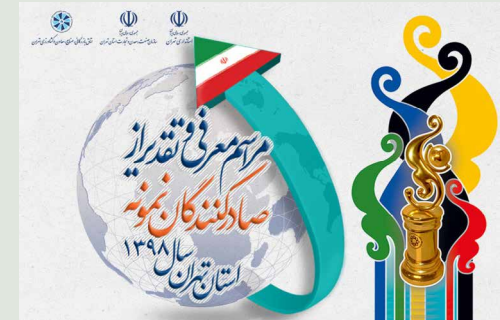
آئین معرفی و تجلیل از صادرکنندگان نمونه استان تهران برگزار می‌شود

سومین همایش معرفی و تقدیر از صادرکنندگان نمونه سال ۹۸ استان تهران روز سه‌شنبه ۱۰ دی ماه از ساعت ۸ صبح در محل هتل ارم تهران برگزار می‌شود.