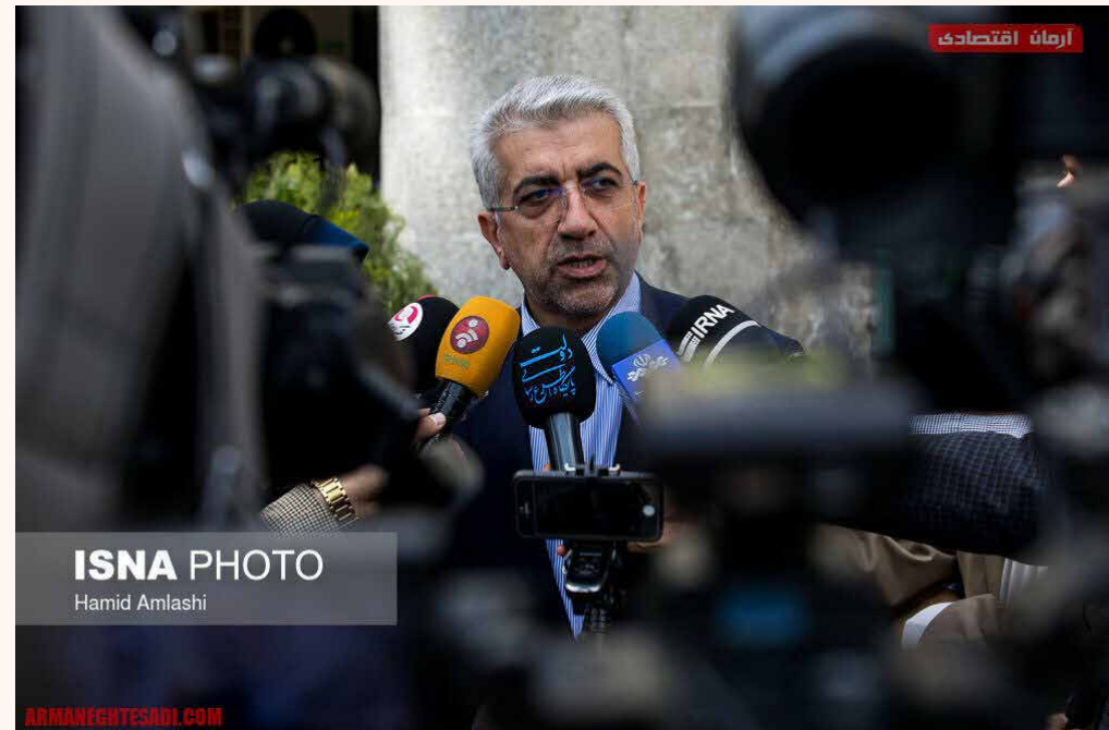
ISNA PHOTO Hamid Amlashi