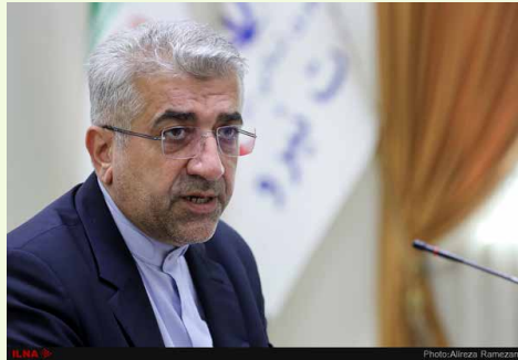
وزیر نیرو مطرح کرد:

وی در پاسخ به سوالی در خصوص انتقال آب از دریای عمان گفت: انتقال آب از دریای عمان به فلات مرکزی و سرزمین اصلی از مدت‌ها قبل در دست مطالعه بوده و ۱۷ استان کشور می‌توانند و نیاز دارند که از این منبع نیز بهره‌مند شوند و تاکنون مطالعات در این حوزه به اتمام رسیده و گزارش آن در شورای عالی آب مطرح و به تصویب رسیده است.