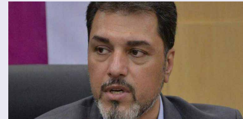
کشف قیمت برق در بورس انرژی واقعی نیست