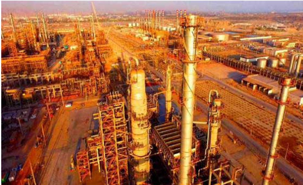
مسئول نیروگاه شرکت پالایش گاز ایلام: