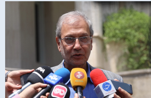
سخنگوی دولت خبر داد:

وی تاکید کرد: بر همین اساس دولت امروز این اختیار را به وزیر داد تا برق تولیدی در این بخش را به نحوی خریداری کنند که برای سرمایه‌گذاران مقرون به صرفه باشد و تمایلی بیشتری برای حضور در این بخش پیدا کنند.