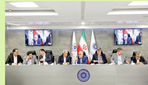
در شورای گفت‌وگو ارائه شد

فرهاد دژپسند وزیر اقتصاد و رئیس شورای گفت‌وگوی دولت و بخش خصوصی در این نشست از آمارهای اقتصادی ابراز رضایت کرد. او از تغییر جهت فضای اقتصادی سخن گفت و تصریح کرد: خوشبختانه وضعیت اقتصادی کشور از شرایط نگران‌کننده به وضعیت امیدوارکننده تغییر مسیر داده است. سال گذشته همگی نگران رشد اقتصادی سال ۹۸ بودیم چراکه پیش‌بینی می‌شد در سال ۹۸ رشد اقتصادی به شدت منفی باشد؛ اما خوشبختانه این پیش‌بینی‌ها اتفاق نیفتاد. آمار سه ماه اول سال جاری نشان می‌دهد رشد اقتصادی غیرنفتی