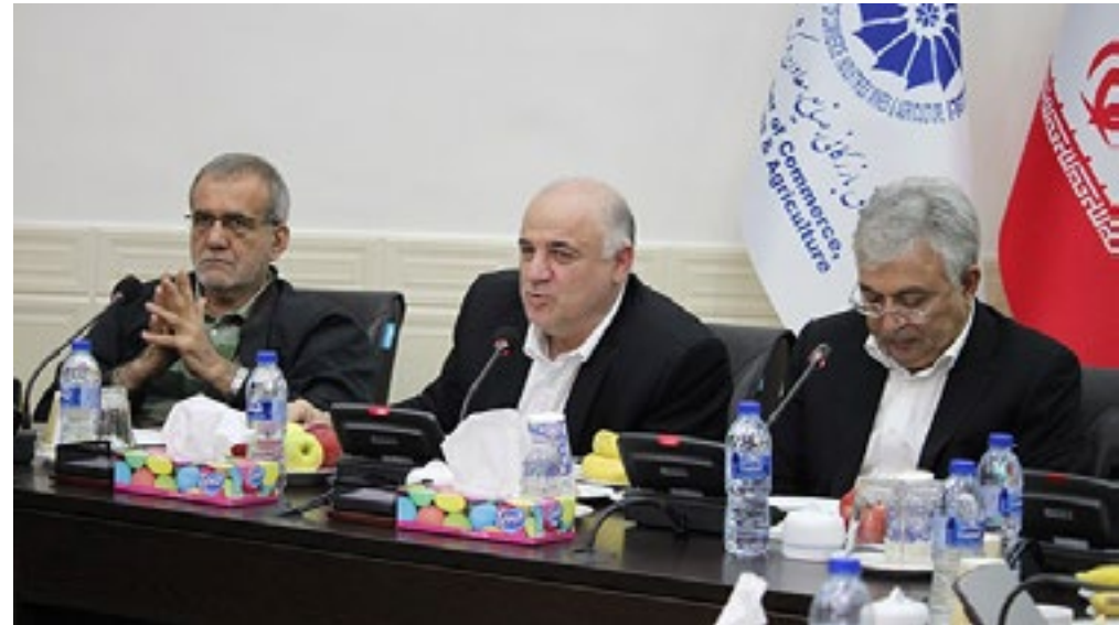
معاون وزیر نیرو در اتاق تبریز

مسعود پزشکیان نایب رئیس اول مجلس شورای اسلامی در این نشست گفت: وقتی که فعالان صنعتی استان آذربایجان شرقی در شرایط سخت اقتصادی به فکر توسعه واحدهای تولیدی و صنعتی خود هستند باید مشکلات پیش روی فعالان اقتصادی را در راستای توسعه همه جانبه استان حل کنیم. او از مسئولان کشوری و استان در حوزه برق خواست تا در کوتاه‌ترین زمان ممکن مسائل و مشکلات فعالان اقتصادی در حوزه برق را حل کنند.