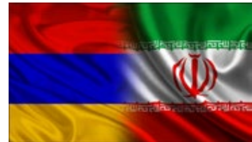
اتاق بازرگانی، صنایع، معادن و کشاورزی تهران برگزار می‌کند

علاقمندان به مشارکت در این همایش می‌توانند با تکمیل فرم ثبت‌نام (در انتهای همین خبر) و ارسال آن تا پایان روز چهارشنبه ۲۹ آبان ماه ۱۳۹۸ آمادگی خود را اعلام کنند. همچنین برای دریافت اطلاعات بیشتر، امور بین‌الملل اتاق بازرگانی تهران از طریق شماره تماس ۸۸۷۲۱۰۴۳ آماده پاسخ‌گویی به سوالات است.