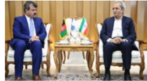
سفیر افغانستان در دیدار با غلامحسین شافعی