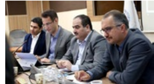
در نشست کمیسیون فناوری اطلاعات و ارتباطات اتاق ایران مطرح شد

او همچنین با انتقاد از عملکرد وزارت ارتباطات و فناوری اطلاعات در حوزه فاوا، افزود: متأسفانه عملکرد این وزارتخانه نشان می‌دهد که وزارت ارتباطات و اطلاعات روی برخی مسائل متوقف