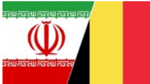
ملاقات شرکت‌های بزرگ اروپایی با بخش خصوصی ایران در اتاق بازرگانی تهران

نشست هیات تجاری ایالت والونیا بلژیک روز شنبه ۹ آذرماه در محل اتاق تهران برگزار خواهد شد و علاقمندان برای کسب اطلاعات بیشتر می‌توانند با اداره کشورهای توسعه‌یافته اتاق تهران به شماره ۸۸۷۲۱۲۹۱ تماس بگیرند.