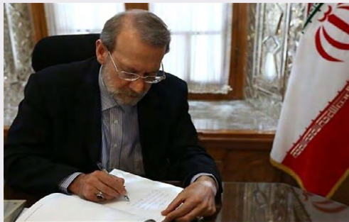
رئیس مجلس شورای اسلامی:

به علاوه، خانوارهایی که مصرف آب یا برق ماهانه آنها پایین تر از الگوی مصرف بوده و در بازه زمانی اول خرداد تا پایان شهریور، در مقایسه با دوره مشابه سال قبل، مصرف خود را کاهش دهند، مشمول تخفیف به میزان مصرف کاهش یافته با نرخ اولین پله مصرف خواهند شد.