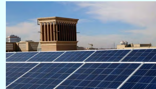
مدیرکل دفتر تدوین و تسهیل مقررات ساتبا خبر داد:

لونی در پایان گفت: در حال حاضر بیشترین نیروگاه‌های خورشیدی پشت بامی در استان‌های کرمان (۹۲۱ نیروگاه)، خراسان رضوی (۷۶۱ نیروگاه) و اصفهان (۲۴۸ نیروگاه) احداث شده و به بهره‌برداری رسیده‌اند.