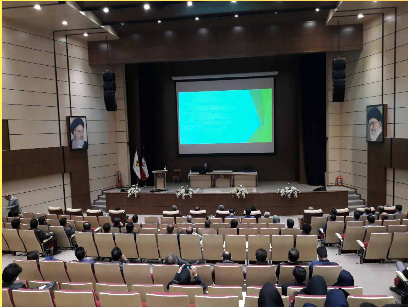
با حضور متخصصان سراسر کشور