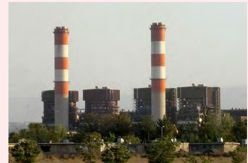
بهره‌برداری از نیروگاه بزرگ ۱۴۰۰ مگاواتی ارومیه تا پایان سال