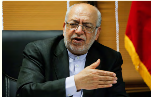
وزیر سابق صنعت، معدن و تجارت:

با تصویب دولت همچنین مبلغ ۴۳ میلیارد ریال به صورت هزینه ای برای هزینه های آواربرداری، پشتیبانی و ارائه خدمات فنی و مدیریتی و مبلغ یکصد میلیارد ریال به صورت تملک دارایی های سرمایه ای برای اصلاح بافت شهری در معرض خطر رانش و ایمن سازی آن اختصاص یافت.