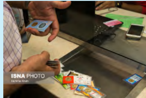
سودهای کلان در معاملات کاغذی

این شرکت‌ها در دوم مردادماه از طریق مزایده واگذار خواهند شد، البته این‌که برای آنها مشتری وجود داشته باشد یا خیر در روز مزایده مشخص می‌شود. از جمله این بنگاه‌ها می‌توان به جایگاه سوخت خوی