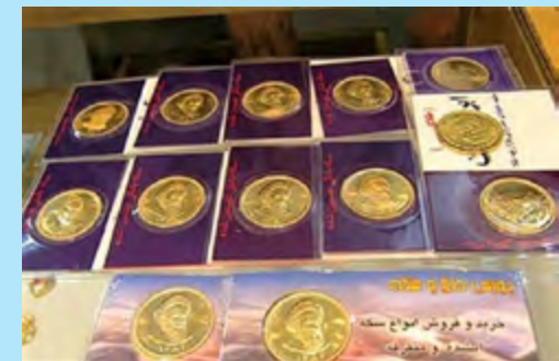
امسال رقم خورد؛

علاوه بر این تحولات، بانک مرکزی و سایر دستگاه های ذی ربط هم تمام تلاش خود را به کار بسته اند تا با عرضه سکه در بازار و همچنین کنترل نرخ ارز، به بازار سر و سامانی داده و مدیریت بازار را برعهده بگیرند. با اقدام به موقع دولت در این بازار جایی برای جولان و سفته بازی دلالت وجود نخواهد داشت. البته توجه به این نکته ضروری است که در این میان مردم نیز نقش قابل توجهی دارند تا با اقدام صحیح و جلوگیری از رفتارهای هیجانی در بازار، همسو با بانک مرکزی و دولت حرکت کنند.