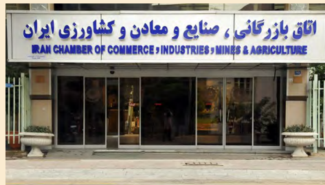
با دستور کار برگزاری انتخابات رئیس و هیئت رئیسه اتاق ایران