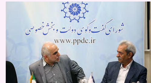
رئیس اتاق ایران در نشست شورای گفت‌وگو

رئیس پارلمان بخش خصوصی با بیان این سؤال که چرا در زمان ممنوعیت صادرات پپاز امکان